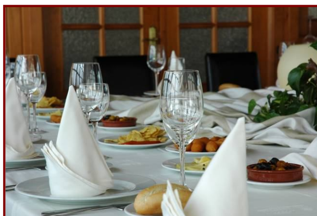
Tabla de embutidos ibéricos Tabla de quesos Cuchara de habitas con jamón Gambas al ajillo Mini tostadas de escalibada Mini tostadas de butifarra negra Surtido de canapés Surtido de brochetas Mini croquetas de bacalao Mini croquetas de pollo Salmón marinado Zumos variados Aguas minerales Sangría de vino, refrescos o cerveza

Reserva previa obligatoria. Mínimo 25 pax. Máximo 150 pax.